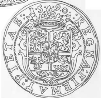
Fig. 5. Gørvel Fadersdatters og Peder Brahes specie 1590 (Hede 43).