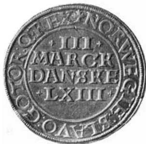
Fig. 1. Lave Brahes speciedaler 1560 (Hede 8A).