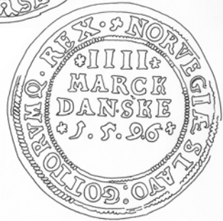
Fig. 6. Gørvel Fadersdatters (?) specie 1596 (Hede 45).