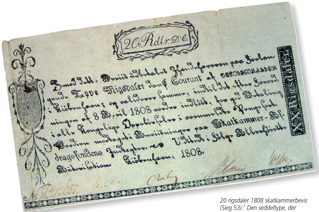
20 rigsdaler 1808 skatkammerbevis (Sieg 53). 7 Den seddeltype, der blev dumpet i Østersøen.