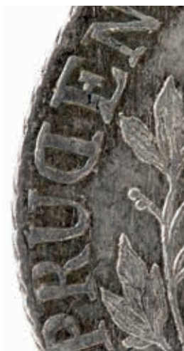
Fig. 9. Udsnit af Bauerts stempel med tekstfejl.

Møntmester Knoph rapporterede d. 21. marts 1765, at der ved prægningen af de 69.250 mønter i 1764 var forbrugt og destrueret 11 stempler, alle skåret af Bauert. Der var desuden henlagt 7 stempler (3 af Bauert, 2 af Adzer og 2 af Wolff), 20 men det fortælles ikke, om de havde været