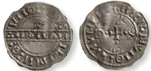
Figur 4. Stempelsæt 9/23, kendt i 5 eksemplarer: ex L.Chr. Petersen auk. 1917, nr. 334 KP 1350.31, foto Rikke Sekkelund.