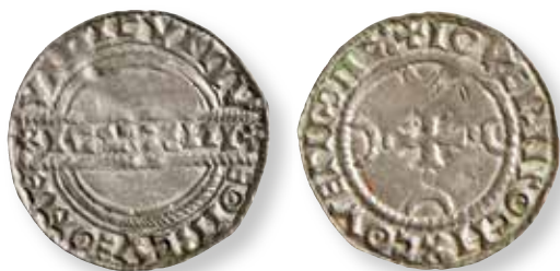
Figur 9. Stempelsæt 19/14, kendt i 19 eksemplarer: Lovns FP 329.70, foto Rikke Sekkelund.