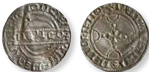
Figur 10. Stempelsæt 20/28, kendt i 4 eksemplarer: Lovns FP 329.68, foto Rikke Sekkelund.