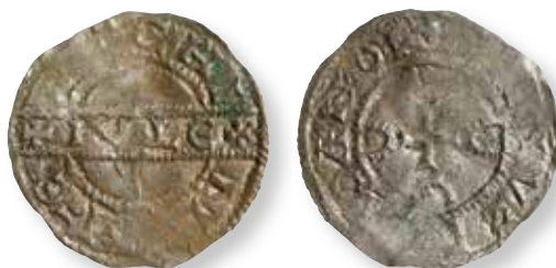
Figur 15. Stempelsæt 16/17, kendt i 1 eksemplarer: Lübeck KP 324.2.