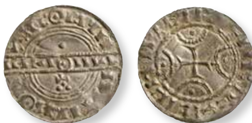
Figur 14. Stempelsæt 23/20, kendt i 5 eksemplarer: Kongsø FP 973.65, foto Rasmus H. Nielsen.