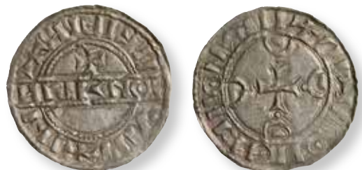
Figur 8. Stempelsæt 5/8, kendt i 11 eksemplarer: Hågerup FP 2113.32, foto Rikke Sekkelund.