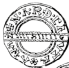
Hardeknud Hbg 50