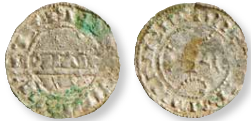
Figur 2. Stempelsæt 10/10, kendt i 6-8 eksemplarer: Errested FP 10907.79.