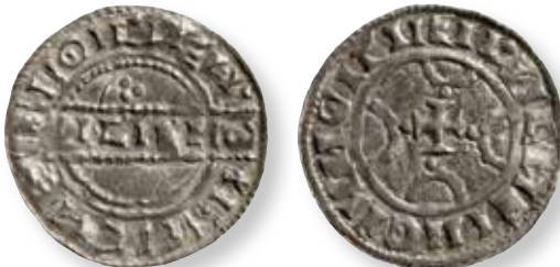
Figur 7. Stempelsæt 12/22, kendt i 6 eksemplarer: ex Chr.J. Thomsen auk. 9981 GP 612.234, foto Rikke Sekkelund.