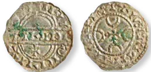
Figur 6. Stempelsæt 4/4, kendt i 6 eksemplarer: Errested FP 10907.59, foto Rasmus H. Nielsen.