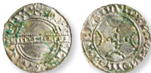
Figur 13. Stempelsæt 1/1, kendt i 4 eksemplarer: Errested FP 10907.152