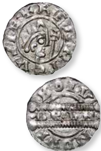
Frisland. Bruno III 1050-1057. Penning (16.5mm, 0.66g). HENRICVS RE+, / BOIV – NDVI, BR•VN

Ved stempelanalysen er alle tilgængelige eksemplarer taget i betragtning, uanset om deres proveniens er kendte eller ej (se bilag 1). Antallet af