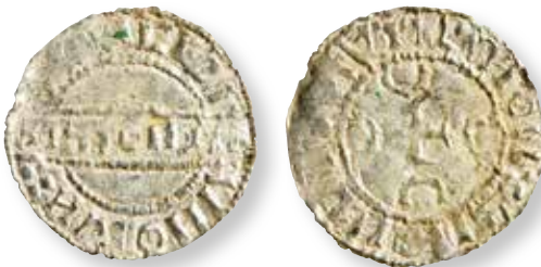
Figur 5. Stempelsæt 3/3, kendt i 4 eksemplarer: Errested FP 10907.74.