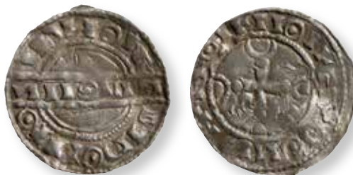
Figur 12. Stempelsæt 18/21, kendt i 11 eksemplarer: Kongsø FP 973.75, foto Rasmus H. Nielsen.