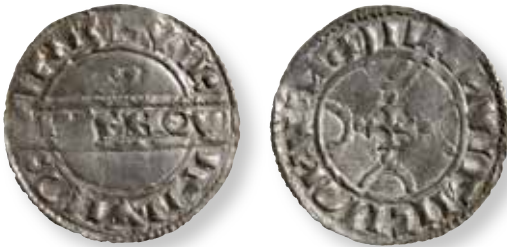
Figur 3. Stempelsæt 8/13, kendt i 4 eksemplarer: Errested FP 10907.1, foto Victor Bizoev.