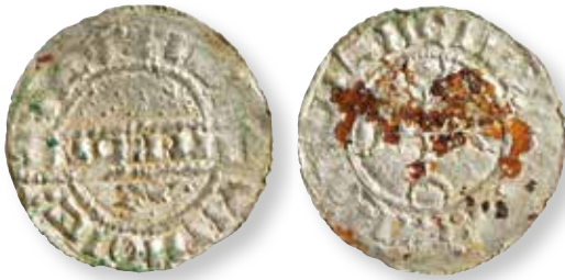
Figur 1. Stempelsæt 6/9, kendt i 6 eksemplarer: Errested FP 10907.122