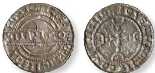
Figur 11. Stempelsæt 20/14, kendt i 8 eksemplarer: Lovns FP 329.69.