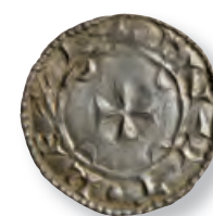
Knud den Hellige, Hbg 3