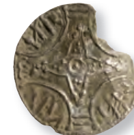
Svend Estridsen, Hbg 39a