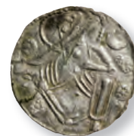
Svend Estridsen, Hbg 32