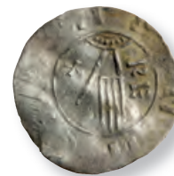
Henrik III, Deventer, Hbg 563