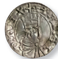
Harald Hen, ny type