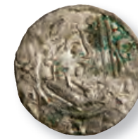
Oluf Hunger, Hbg 5 var.