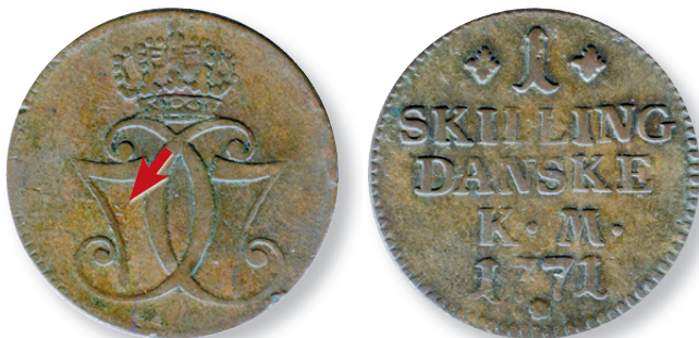
Fig. 4. Forsidestemplet svagt beskadiget af bagsidestemplet

mønter af god bevaringskvalitet at afsløre den type skader, og har sammentrykningerne tilmed været ganske svage, vil de kun være synlige på mønter af allerhøjeste kvalitet. Det kan meget vel tænkes, at sammentryknings-uheld er forekommet langt oftere, end man måske umiddelbart forestiller sig.