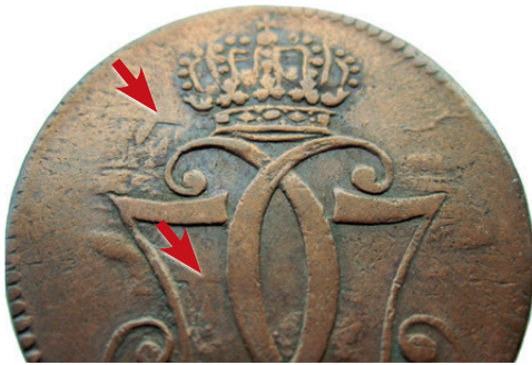
Fig. 2. Forsidestemplet kraftigt beskadiget af bagsidestemplet