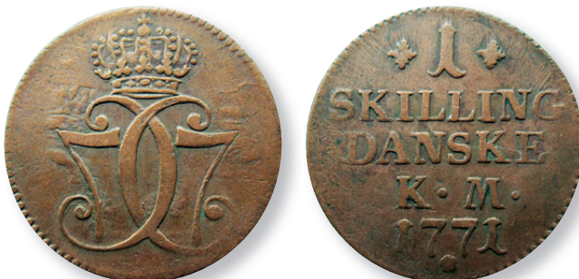
Fig. 1. 1-skilling 1771 præget med “sammentrykkede stempler”