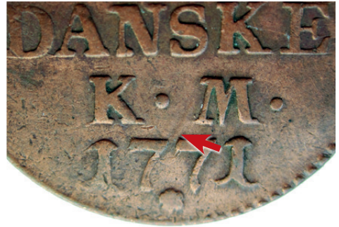
Fig. 3. Bagsidestemplet svagt beskadiget af forsidestemplet

mellem KM og 1771 anes konturerne af et "V", der stammer fra den nederste del af forsidestemplet, hvor C'erne i monogrammet krydser hinanden. Møntens noget ridsede overflade på dens øvre del kan muligvis tolkes som værende et resultat af slibning.