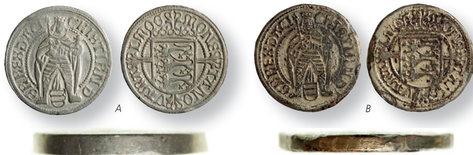
Figur 4: Piedforter fra den Kongelige Mønt og Medaljesamling i København. Begge mønter er også vist fra siden, så deres tykkelse kan ses.