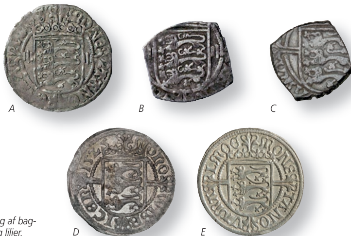
Figur 2: Sammenligning af bag- sides løver og liljer.