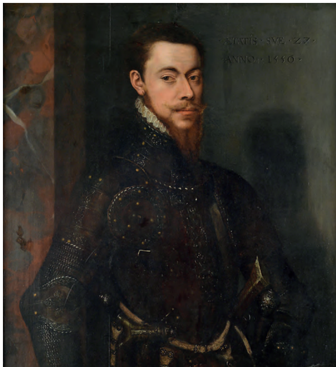
Fig. 4. Günther XLI (1529-83) kaldet "der Streitbare" var en velanset lejetropsfører.

Olie på træ 1556 af Antonis Mor (?). Schlossmuseum Sondershausen, Inv.-Nr. KB 184.