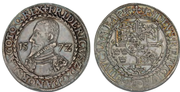
Fig. 1. Speciedaler 1572. T72.10, F5/B13. Bruun Rasmussen Kunstauktioner auktion 868 (Arne Andreasen II) lot 2, se ældre provenienser i oversigten side 82.

Sølvet til en værdi af 150.000 dalere 4 blev accepteret af svenskerne som betaling ("løsen") for at få frigivet fæstningen Elfsborg 5 ved freden i Stettin den 13. december 1570, der afsluttede Den Nordiske Syvårskrig (1563-70). Elfsborg lå ved Götaelvens udmunding ved Göteborg og fungerede som svensk grænsefæstning mellem Sverige og Norge. Den udgjorde Sveriges eneste havn ud mod Kattegat, og var derfor af afgørende betydning for landet.