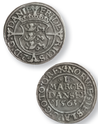
Fig. 3. 1 mark 1563. 9,19 g. RP 432 (Beskrivelsen af 1791 nr. 31).

Med en udmøntning på 57.550 rigsdaler og de fundne stempeltal fås en gennemsnitlig stempelholdbarhed på henholdsvis 7.200 mønter/forsidestempel og 2.200 mønter/bagsidestempel. Til sammenligning kan nævnes, at der af den ligeledes hammerprægede københavnske speciemønt 1624-1634 (H. 55-62) i alt blev slået 116.036 rigsdaler 25 , hvor der til speciedalere – inklusive multiple specier – blev brugt 15 forside- og (mindst?) 91 bagsidestempler 26 . Regnes udmøntningen af sidstnævnte alene at have omfattet enkeltspecier 27 , giver det en gennemsnitlig stempelholdbarhed på henholdsvis 7.700 mønter/forsidestempel og 1.275