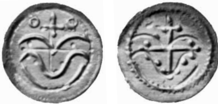
Fig. 3. Korsmønt fra Pilhus-skatten, fotograferet i 1939. 1,5:1.