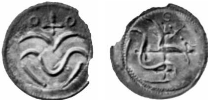
Fig. 5. Korsmønt fra Pilhus-skatten, fotograferet i 1939. 1,5:1.