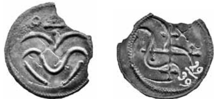
Fig. 6. Samme mønt 2009 med kraftig skade. Stykket er bevaret, men ikke med på foto. 1,5:1.