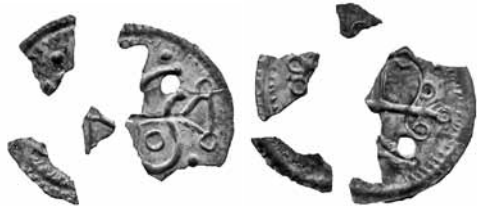
Fig. 2. Korsmønt fundet på udgravningen i Vorbasse. Var itu, da den blev fundet. Cirka 1,5:1.