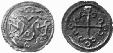
Fig. 1. Korsmønt, fundet på Trelleborg. 1,5:1

1 Der er desuden 6 karolingiske mønter fra skattefund og 4 fra ukendte fundomstændigheder. De fleste af disse er fundne før 1988.