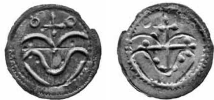
Fig. 4. Samme mønt 2009 med mindre kantskade. 1,5:1.