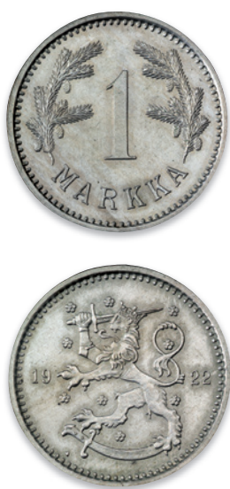
FIG. 1: FINLAND 1 MARK 1922. 24 MM. FREMSTILLET PÅ DEN KGL. MØNT I KØBENHAVN. DET LILLE HJERTE PÅ FORSIDEN ER MØNTSTEDSMÆRKET FOR DEN KGL. MØNT I KØBENHAVN. NATIONALMUSEET, DEN KGL. MØNT- OG MEDAILLESAMLING, GP 1709.

LÅ PÅ GAMMELHOLM I KØBENHAVNS CENTRUM. MØNTEN PÅ AMAGER ERSTATTED I 1923 DEN GAMLE MØNT. 6