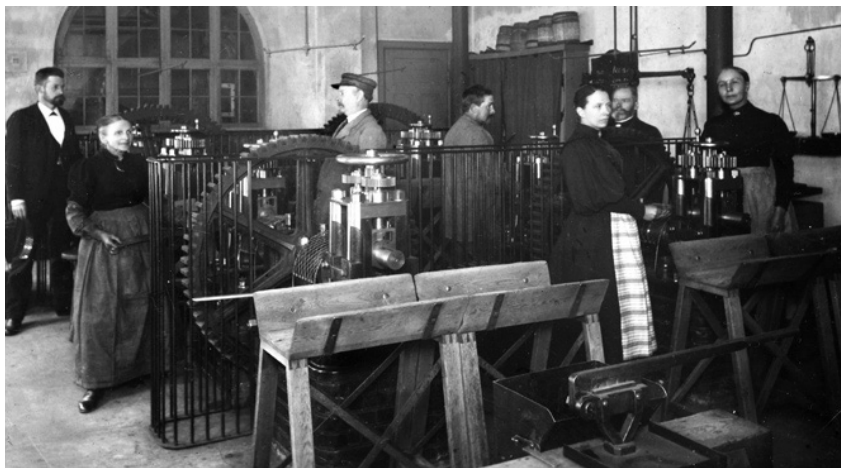
FIG. 5: UDSNIT AF VALSERUMMET PÅ MØNTEN I KØBENHAVN. FORMENTLIG 1890'ERNE. DER ER GASBELYSNING OG ANTAGELIGT OTTE VALSEVÆRKER. I ALT VAR DER FORMENTLIG 16 VALSEVÆRKER I VALSERUMMET. I FORGRUNDEN SES EN ART PLADESAKS TIL AT KLIPPE TENE OVER MED SAMT BUKKE TIL AT PLACERE TENE PÅ. BILLEDET ER BESKÅRET, SÅ BLANDT ANDET KRAFTOVERFØRINGSAKSLEN I LOFTET IKKE SES. DET KONGELIGE BIBLIOTEK, KØBENHAVN. FOTO: FREDERIK RIISE (1863–1933).

MED HENSYN TIL MØNTERNES TYKKELSE. DERFOR SENDTE FINLANDS BANK 20 STK. 1 MARK FRA 1921 TIL MØNTEN, SÅ DER KUNNE SAMMENLIGNES. DET FJERNEDE USIKKERHEDEN, OG UDMØNTNINGERNE TOG FART. DE 20 MØNTER, SOM VAR FREMSTILLET I BIRMINGHAM, BLEV NATURLIGVIS SENDT TILBAGE TIL BANKEN, DA UDMØNTNINGEN VAR FÆRDIGGJORT. 23