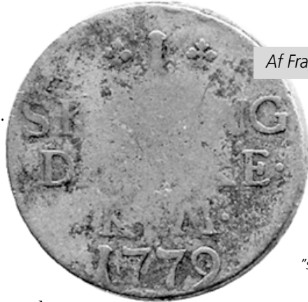
Af Frank Pedersen

Forklaringen er sandsynligvis den, at Bauert i begyndelsen af året 1779 havde glemt, at skillingen skulle antedateres; man må huske på, at der på det pågældende tidspunkt var forløbet 5-6 år, siden der sidst var præget kobberskillingen i København.