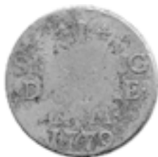
rv 79-2, med karakteristisk "slidt" midterfelt

Omkring 75% af de mønter, der er præget med rv 79-2, har et ens "slidt" midterfelt, som fortæller, at der ikke er tale om almindelig møntslitage, men derimod om en stempeldefekt 8 . Da de resterende 25% af mønterne har et tydeligt præg i det pågældende midterområde, kan det fastslås, at stempeldefekten er opstået i løbet af produktionsløbet.