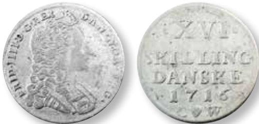
Fig. 1. Ægte dansk 16 skilling 1716, H47 (værdi 15 skilling i møntomløbet). Samme type som den mønt Knud Bech lånte.

2 Møntens pålydende var 16 skilling, men den blev i møntomløbet omtalt som 15 skilling, der var dens nedsatte værdi jfr. forordning af 31. juli 1726. Kirsten Mordhorst, Dansk Pengehistorie. Bind III: Bilag , Danmarks Nationalbank 1968.