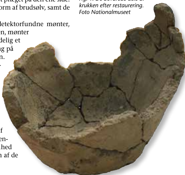
Fig. 1. De bevarede dele af krukken efter restaurering.

En mere detaljeret publikation af Errestedskattens mønter er under udarbejdelse, men allerede nu står det klart, at skattefundet består af en for perioden karakteristisk blanding af kontinentale, insulære og danske mønter. Fundet som helhed har en tæt kronologisk struktur, og hovedparten af de