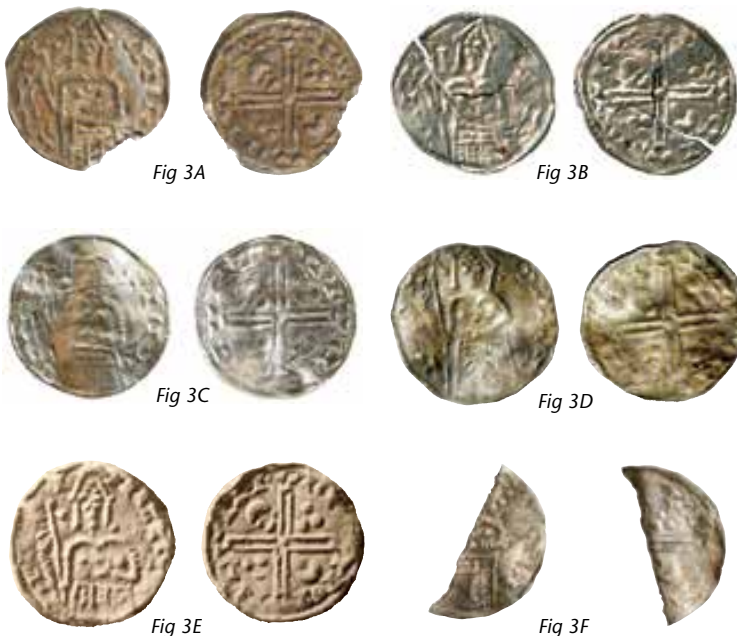
Fig. 3. Hbg Svend Estridsen 66.

Der er kun en enkelt mønt, hvis traditionelle datering falder lidt senere. Det er et relativt velbevaret eksemplar af typen Hauberg 3 Svend Estridsen 66 (Fig. 3A). Møntens forside viser et portræt en face af en stående(?) mand med høj trekantet hovedbeklædning og muligvis pendilier. Personen har sin venstre hånd lagt på kroppen under bry-