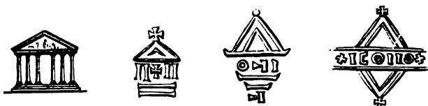
Fig. 7. Altérations successives du temple.

blème dont la dénomination et l'interprétation ont causé beaucoup de soucis aux numismates. Quelques uns l'ont appelé Triquètre (Triquetra); d'autres nœud gordien , ou